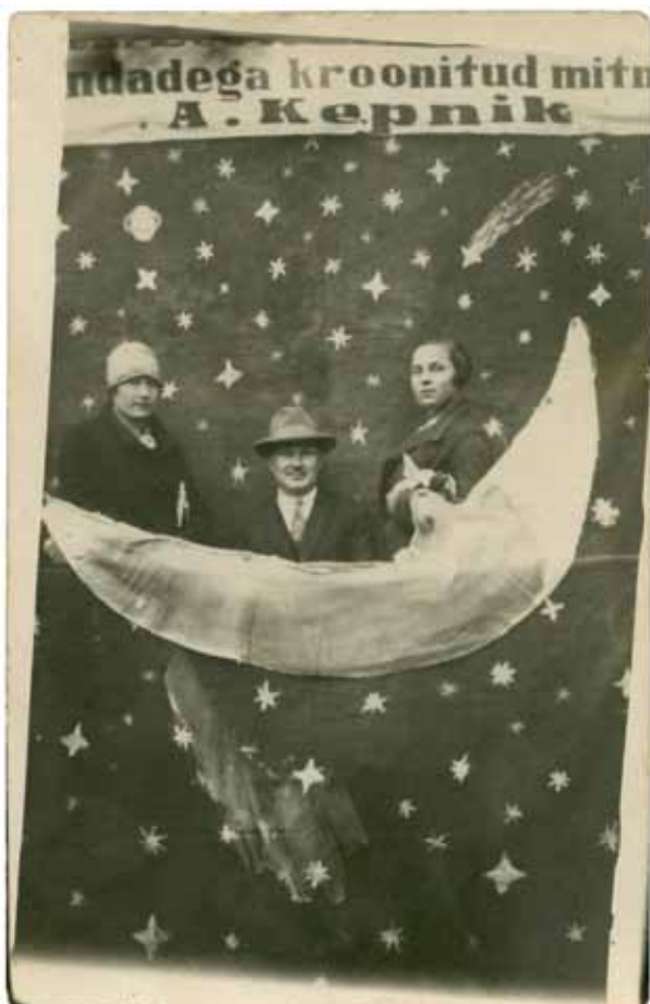
A. Kepnik, Laadal , u 1930. a. Kiirfoto, 9×14cm. Fotomuuseumi kogu, TLM F 10000:296

Linnatänavatel polnud taustad ja rekvisiidid lubatud, neid kasutati arvukalt laadadel.