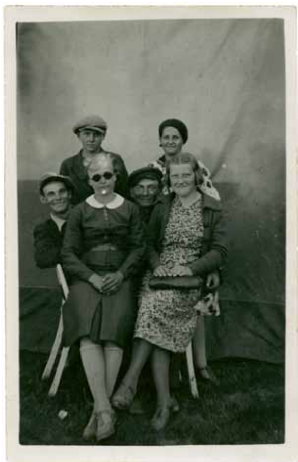
Tundmatu autor, Laadal, u 1930. a. Kiirfoto, 9×14cm. Fotomuuseumi kogu, TLM F 10000:316