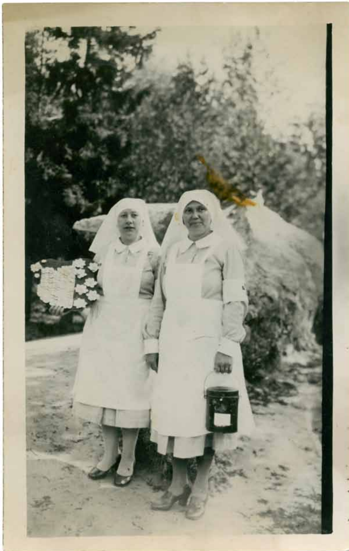
Tundmatu autor, Samariitlased , u 1930. a. Kiirfoto, 9×14cm. Fotomuseumi kogu, TLM F 10000:301