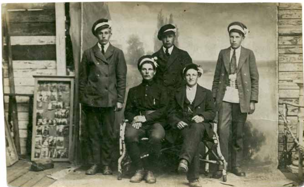
Tundmatu autor, Viis härrasmeest, u 1920. a. Kiirfoto, 9×14cm. Fotomuuseumi kogu, TLM F 10000:266