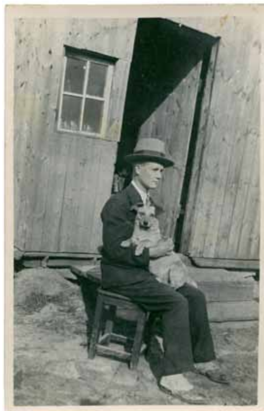
Tundmatu autor, Portree noormehega, u 1930. a. Kiirfoto, 9x14cm. Fotomuuseumi kogu, TLM F 10440