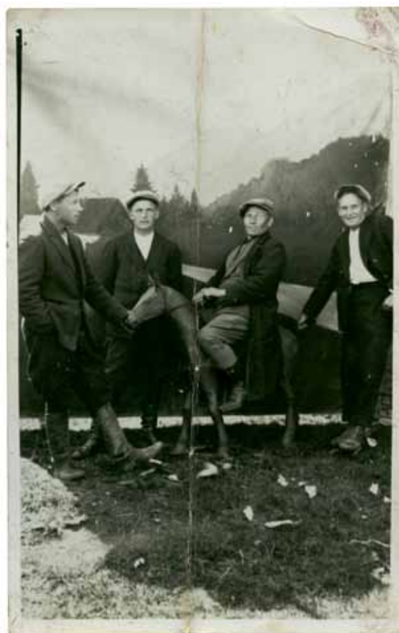
Tundmatu autor, Laadal, u 1930. a. Kiirfoto, 9×14cm. Fotomuuseumi kogu, TLM F 10439