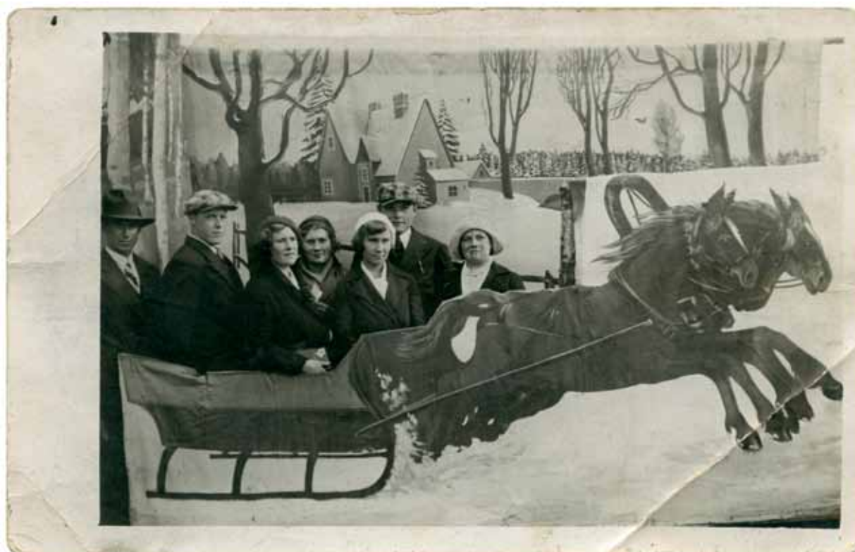
Laadal, 20.07.1933. a. Kiirfoto, 9×14cm.