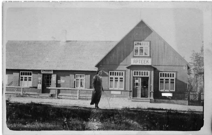
Известно, что на фотографии изображена Вазалеммская аптека, но кем бы могла быть эта женщина?

Две центральные задачи платформы Ajaraik – это маркировка местоположения фотографий и добавление к старым фотографиям нынешней фотoversии, таким образом получается всем знакомая комбинация «прежде и теперь». Чтобы сделать так называемый ремейк, у Ajaraik есть собственное мобильное приложение (пока только для системы Android), которое де-