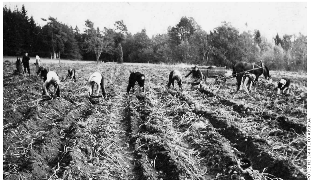
Толоки по сбору урожая картофеля.