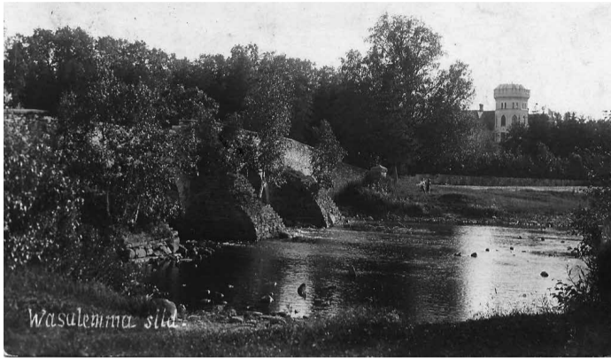
Та же фотография, что и на этой почтовой открытке, отправленной из Вазалемма в Вяйке-Маарья, есть в еще одном альбоме Музея шоссейных дорог и в музее Харьюмаа. На обороте открытки – длинное сообщение, в расшифровке которого может помочь любой желающий. ( Rahvusraamatukogu nlib-digar:70567, ajaraik.ee/photo/28903/ )