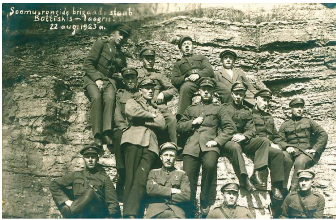
Так подробно датированный снимок – большая редкость, но пока неизвестны имена кого-либо из военных на нем...

Цель и принцип этой платформы заключаются в том, что все могут помочь, добавив свои знания к старым фотографиям.