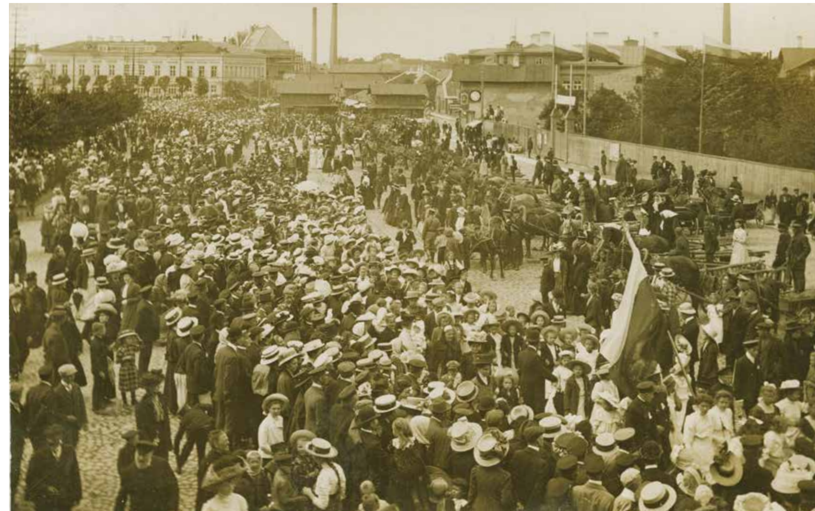
Fotograaf teadmata. VII üldlaulupeo rongkäik Vene turul Tallinnas 1910. aastal. Tallinna Linnamuuseum, F 1140. Unknown photographer. Procession of VII General Song Festival in the Russian market in Tallinn in 1910. Tallinn City Museum, F 1140.

From the same decade, there are also photos of rapid industrialisation. One of such industrial facilities that was fairly extensively photographed was the work of the Sindi Felt Plant at the start of 1880s, with photos of the plant's kindergarten, workers' party, a fire drill, etc. 13 An example of the loyalty to the Russian state is a photo of festivities held in Valga in 1883 in the honor of the coronation of Emperor Alexander III. 14 Russification that started in 1880s and abolishment of the special rights of Baltic Governorates is shown indirectly on photos depicting the last session of the local supreme land court in 1889 that was liquidated in the course of the court reform. 15 In 1887, Reinhold Sachker photographed the fifth people's party in the garden