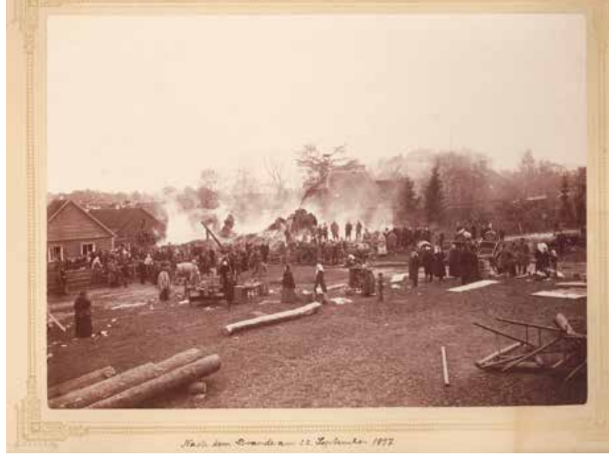
Fotograaf teadmata. Tulekahju Valgas 20. septembril 1897. Valga Muuseum, F 84:1.

Unknown photographer. Fire in Valga on September 20th, 1897. Valga Museum, F 84:1.