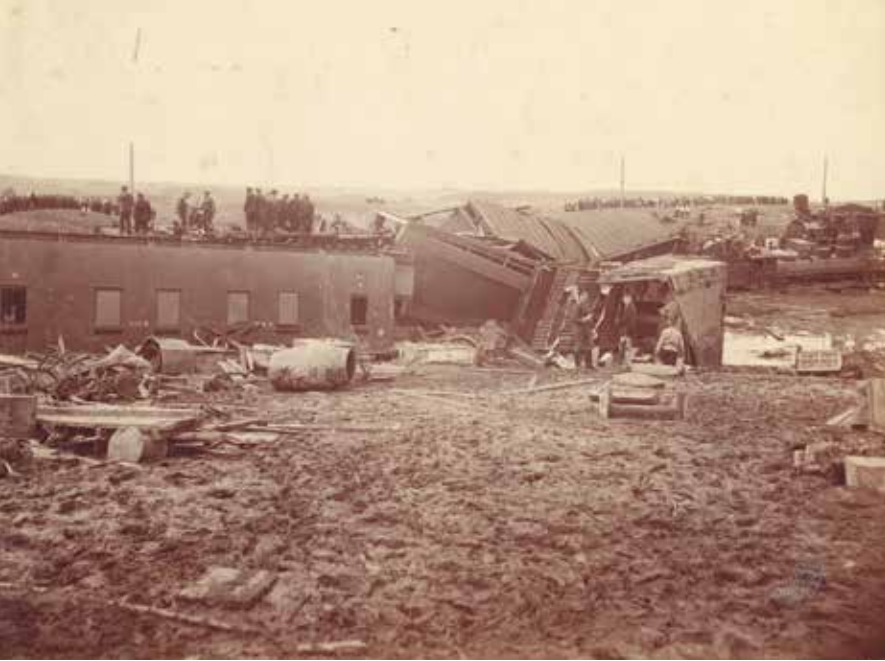
Raudteeõnnetus Puka lähistel 2. mail 1897.

Railway accident near Puka on May 2nd, 1897.