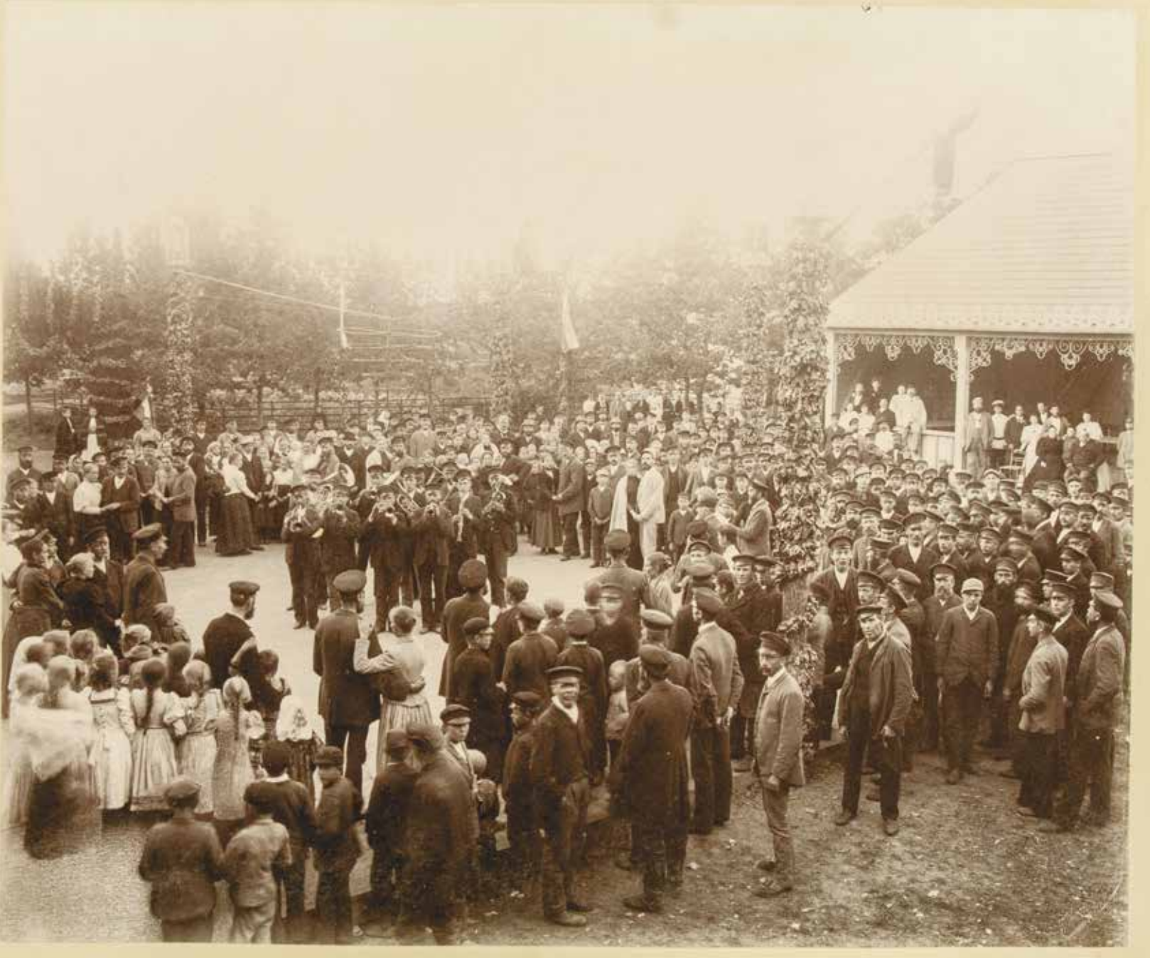
Fotograaf teadmata. Sindi kalevivabriku tööliste pidu pargis 1880. aastatel. Eesti Ajaloomuuseum, F 5077:5. Unknown photographer. Employees of Sindi Felt Factory at a party in the park in 1880ies. Estonian History Museum, F 5077:5.

keiser Aleksander III kroonimise puhul korraldatud pidustus- test Valgas 1883. aastal. 14 1880. aastatel alanud venestamine ja Balti kubermangude erikorra likvideerimine kajastub kaudselt fotol, mis jäädvustab kohtureformi käigus likvideeritud Eestimaa ülemmaakohtu viimast istungit 1889. aastal. 15 1887. aastal pildistas Reinhold Sachker viiendat suurt rahvapidu Vanemuise Seltsi aias Tartus 16 ning Ferdinand Kajander raudteesilla ehitamist üle Väikese Emajõe. 17 Samast aastast pärinevad Mihkel Tilgalt