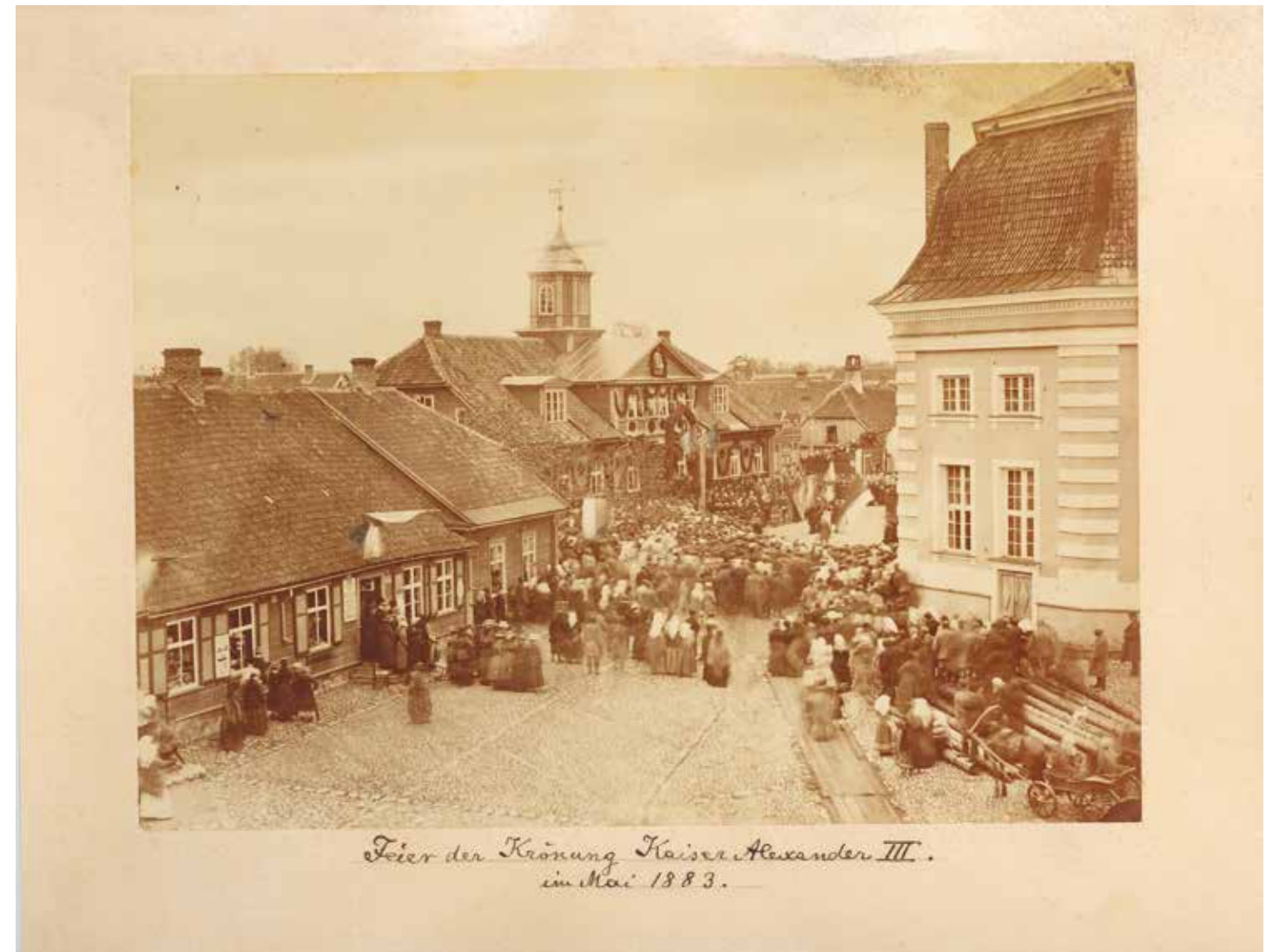
Feier der Krönung Kaiser Alexander III. im Mai 1883.